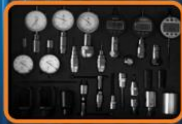
Set de calibración