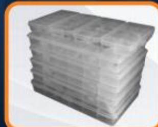
Kit de rondanas de ajuste